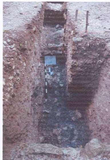
Sub operación 50.5 Identificación de lote correspondiente a empedrado de calizas. Fotografía Livni Almira, 2021.