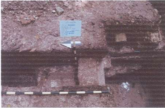
Sub operación 50-5. Identificación de roca caliza tallada, banqueta y piso. Fotografía Livni Almira, 2021.