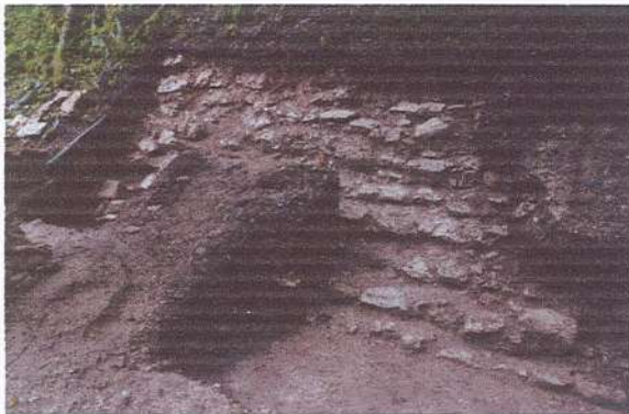
Sub operación 1.31. Identificación de escalinata de acceso alero sur fachada oeste estructura B-20. Fotografía Livni Almira, 2021.