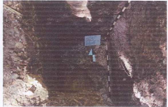
Sub operación 1-25 registro 1. Identificación de roca caliza tallada. Fotografía Livni Almira, 2021.