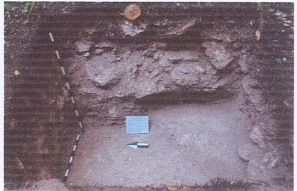
Sub operación 1.32. Identificación de muro y piso, en alero sur fachada oeste estructura B-20. Fotografía Livni Almira, 2021.