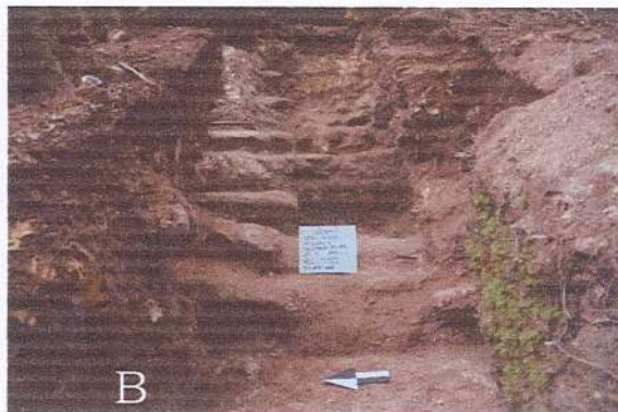
A. Liberación de escombros Estructura B-17. Sub operación 1-31. B. Registro 3 de trinchera 24, alero sur fachada oeste, estructura B-20.

(Livni Almira Zunun) Livni Naidy Almira Zunun