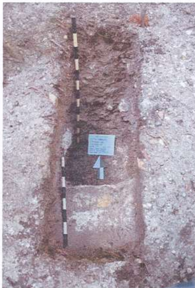
Sub operación 50-5. Identificación de piedra caliza.

3.3. Se realizó la consulta de reportes arqueológicos del DECORSIAP para obtener información de trabajos antes realizados en las áreas intervenidas del sitio.