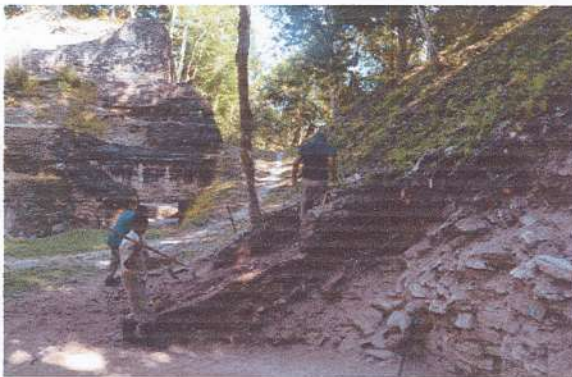
Sub operación 31-10 proceso de liberación de escombros estructura B-17. Fotografía Livni Almira, 2021.